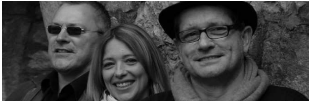
MANGOLD Golden Ballads of Rock and Pop